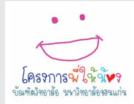
โครงการหัวใจหัวใจ บัณฑิตวิทยาลัย ๓๔ ปี